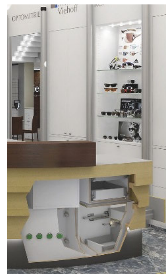
Vectorworks Interiorcad enthält ein umfangreiches Paket an 3D-Beschlägen.

Um neuen Anforderungen der Arbeitswelt gerecht zu werden, wurden Arbeitszeitmodelle in den Betriebskalender integriert. So lassen sich für Mitarbeitergruppen individuellere Arbeitszeiten vordefinieren. Vectorworks interiorcad und Profacto 2016 werden ab Ende Januar verfügbar sein. (mh)