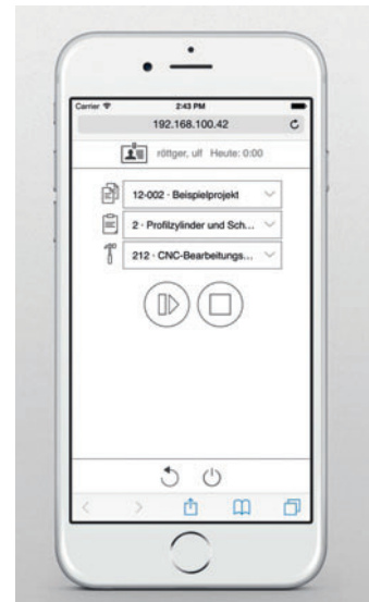
/ Profacto 2015 hat eine kostenlose Web-Zeiterfassung an Bord.

loggen, Projekt, Position und Kostenstelle wählen, Start-/Stop-Taste drücken – fertig. (cn)