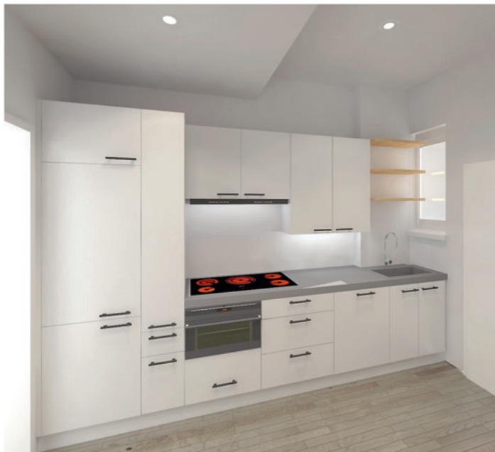
/ Vectorworks Interiorcad (hier: fotorealistische Darstellung einer Küche) fährt in der 2015er-Version mit interessanten Neuheiten und Erweiterungen vor.

Das Softwarehaus Extragroup stellt die 2015er Versionen seiner Branchensoftware Profacto und des CAD-Programms Vectorworks Interiorcad vor.